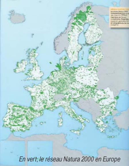
En vert, le réseau Natura 2000 en Europe